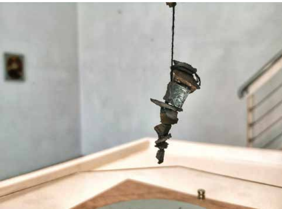
Ritmicas 0 . 1 Noel Omar Saavedra Escultura magneto, metal, madera 30 cm x 30 cm x 30 cm 2017