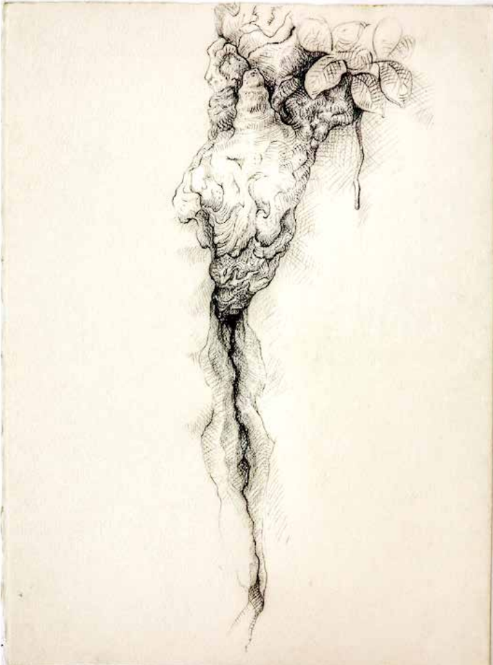
Noel Omar Saavedra Dibujo carbón/ papel 30 cm x 40 cm 2009