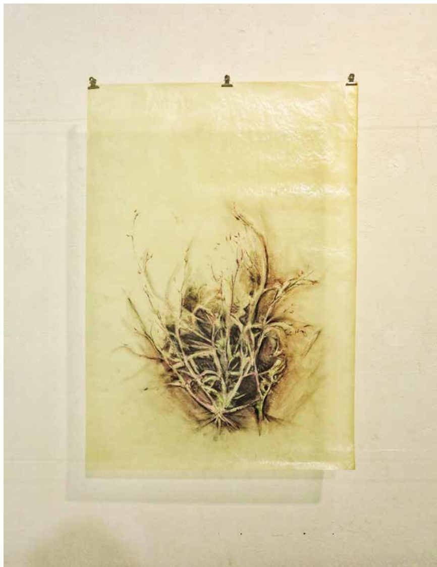
Vestigios y florecencia # 4 Noel Omar Saavedra Dibujo carbón, pastel/ pergamino 50 cm x 70 cm 2021