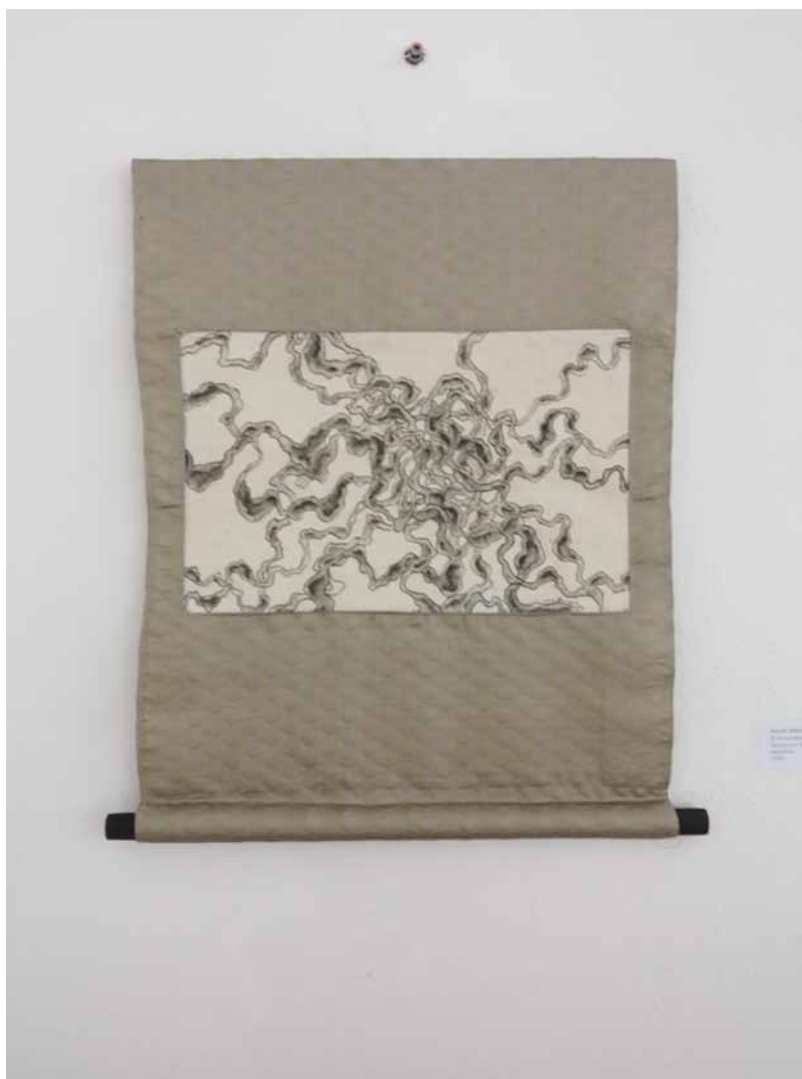
A como est amos 2 T i nt a c hi na sobre t el a 40 x 30 c m 2019