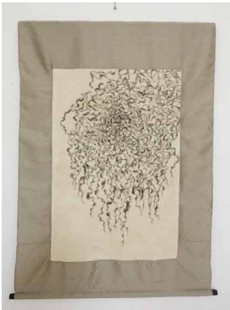
A como est amos 1 T i nt a c hi na sobre t el a 110 x 70 c m 2019