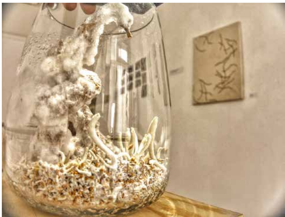
My zel- Labor I nstallacion ( Micelio, papel, fotograf ia) v ariabel2024