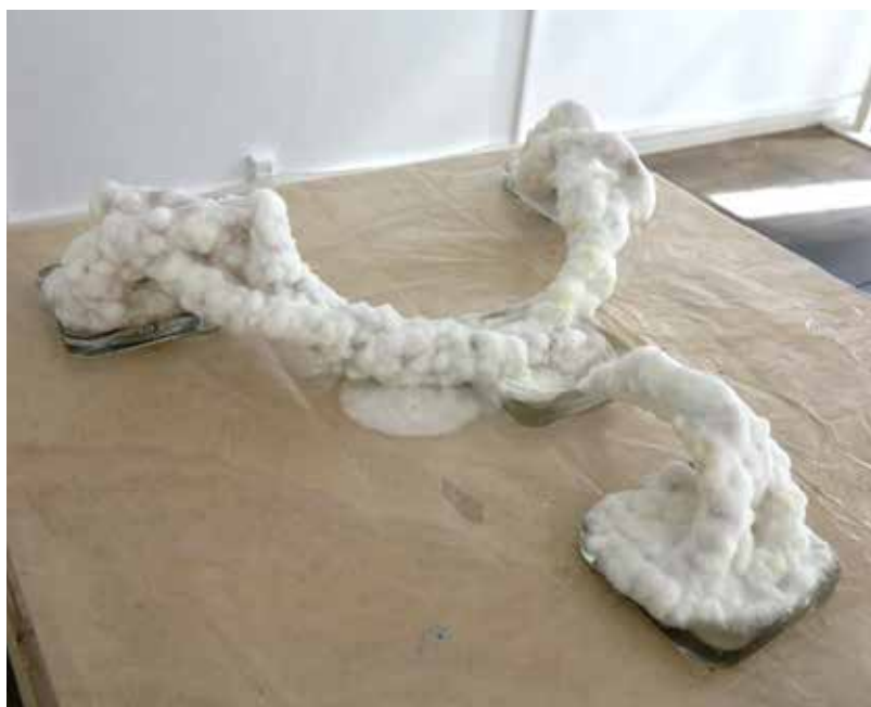
Myzel- Labor I nstallacion ( Micelio, papel, fotografia) v ariabel 2024