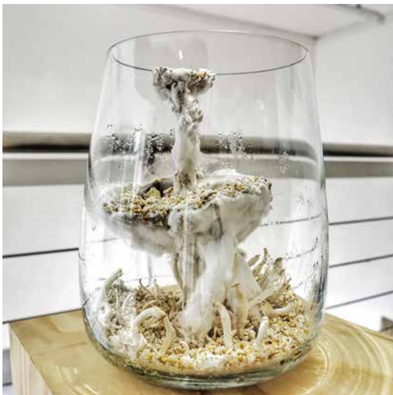
Myzel- Labor I nstallacion ( Micelio, papel, fotograf ia) v ariabel 2024