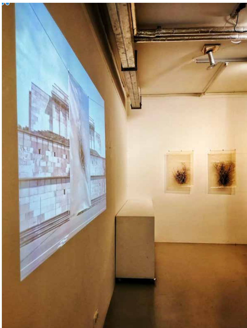
Documentación Exposición Delta, kreis Gallery Núremberg, Alemania 2024