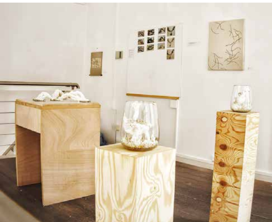
My zel- Labor I nstallacion ( Micelio, papel, fotograf ia) v ariabel 2024