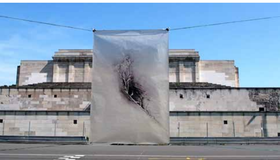
Documentación Exposición Delta, kreis Gallery Núremberg, Alemania 2024