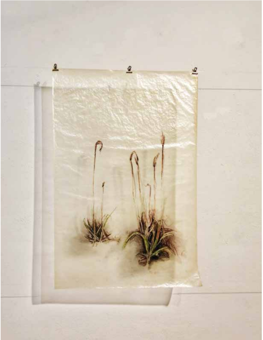
Vestigios y florecencia # 8 Noel Omar Saavedra Dibujo carbón, pastel/ pergamino 50 cm x 70 cm 2021