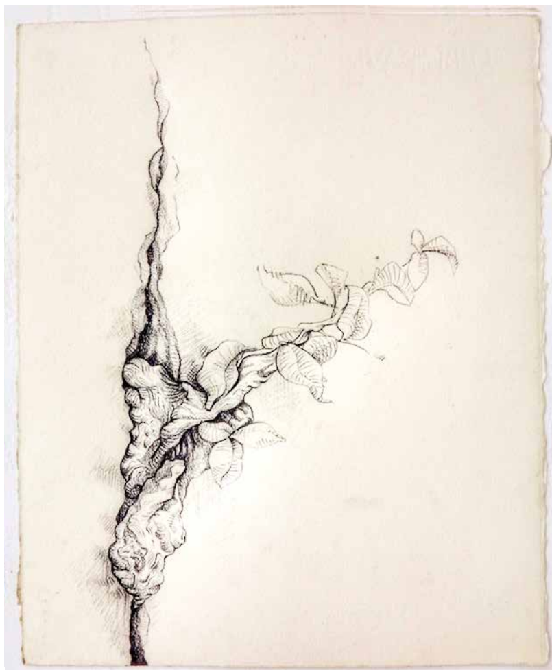
Noel Omar Saavedra Dibujo carbón/ papel 30 cm x 40 cm 2009