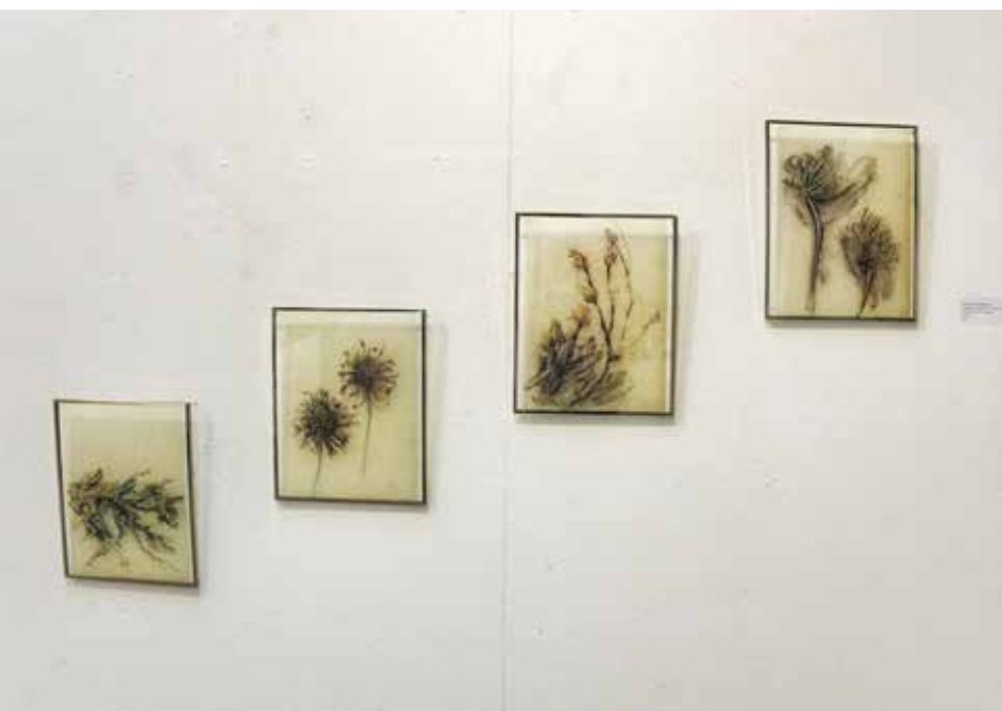
Vestigios y f lorecencia # 9 ,# 10 Vestigios y f lorecencia # 9 ,# 10 # 11 ,# 12 # 11 ,# 12