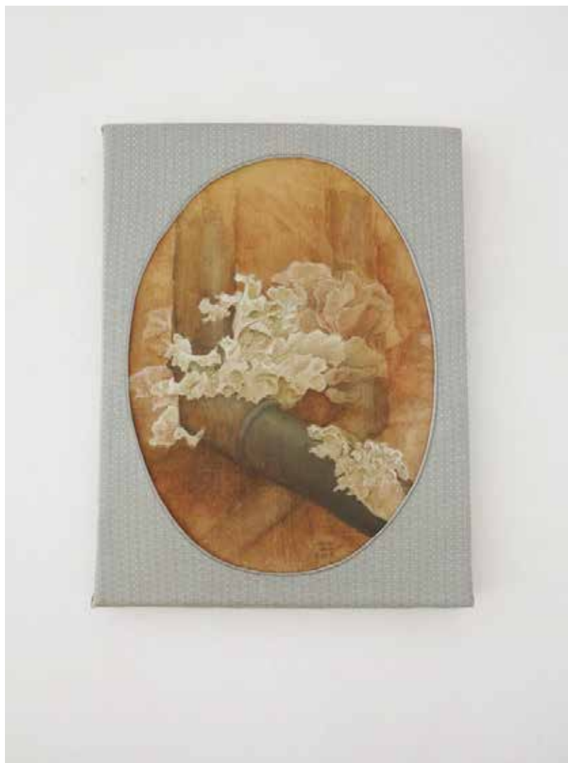
Mundusfungi lacuarelasobre tela 40x30cm 2022