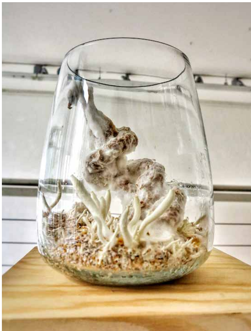
My zel- Labor I nstallacion ( Micelio, papel, fotograf ia) v ariabel 2024