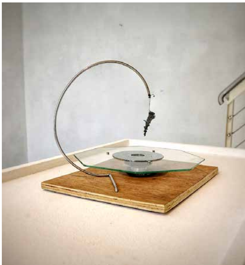
Ritmicas 0 . 1 Noel Omar Saavedra Escultura magneto, metal, madera 30 cm x 30 cm x 30 cm 2017